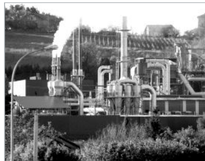
MEJORAS. La empresa afirma que la ampliación permitirá reducir su impacto ambiental.

El presidente del comité de empresa de Inama, por su parte, calificó la decisión como «importante» para que los trabajadores tengan su continuidad asegurada. «Además, con la ampliación la firma alcanzará los 200 empleos», manifestó. En referencia a SOS Muxika apuntó que «les propusimos celebrar reuniones pero no quisieron venir».