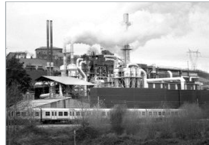
ESTUDIO. El informe encargado por Inama asegura que el ruido se ha reducido.

Por su parte, los vecinos de la localidad que forman parte de la asociación SOS Muxika aseguran que, con estas declaraciones, la sociedad «miente porque incumple la legislación en materia de ruidos», censuraron. Según el colectivo, existe una norma foral que limita el número de decibelios en Muxika a 60 de día y 45 de noche. «Por ello, según los datos ofrecidos por Inama, continuamos como hace tres años. Por mucho que anuncie la empresa que se ha mejorado, eso no es cierto. Las normas están para cumplirlas», manifestaron.